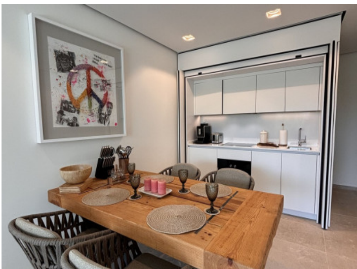
Essbereich und Küche