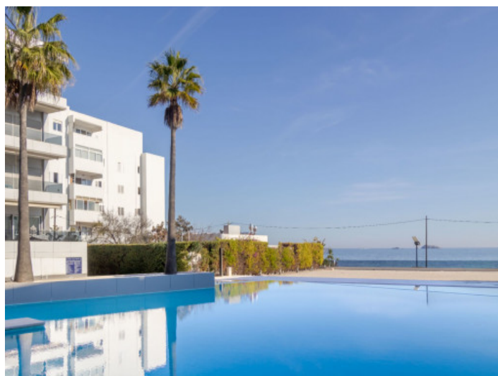
Direkt am Strand