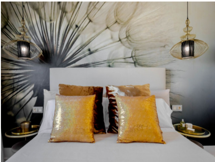
Eines der 2 Schlafzimmer