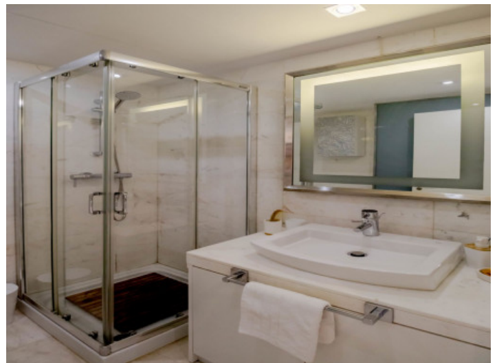
Das 2. Badezimmer

Alle Angaben nach bestem Wissen. Irrtum und Zwischenverkauf vorbehalten. Dieses Exposé ist eine Vorinformation, als Rechtsgrundlage gilt allein der notariell abgeschlossene Kaufvertrag.