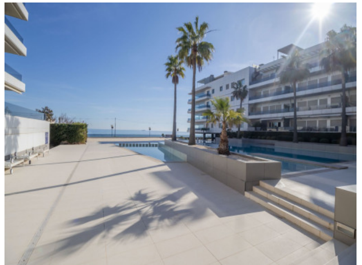
Ansicht auf das Gebäude