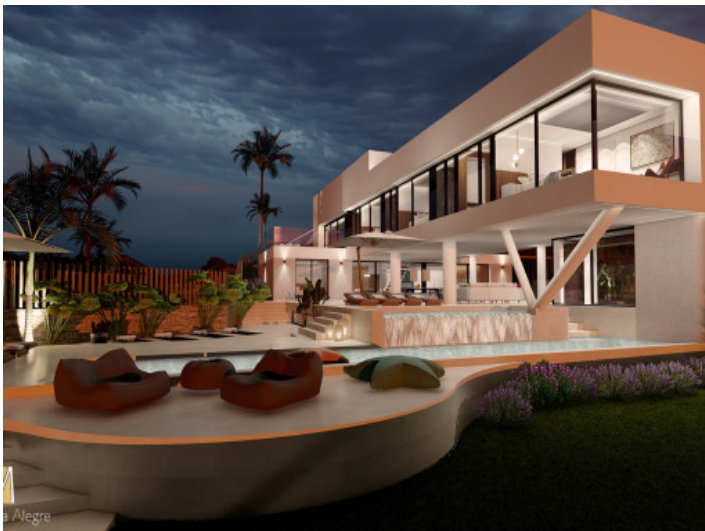
Fantastische Neubau Villa