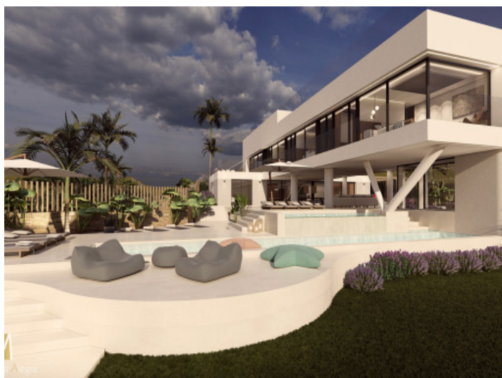
Traumhafte Neubau Villa

Alle Angaben nach bestem Wissen. Irrtum und Zwischenverkauf vorbehalten. Dieses Exposé ist eine Vorinformation, als Rechtsgrundlage gilt allein der notariell abgeschlossene Kaufvertrag.