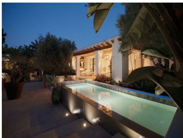
Ansicht auf die Villa

Alle Angaben nach bestem Wissen. Irrtum und Zwischenverkauf vorbehalten. Dieses Exposé ist eine Vorinformation, als Rechtsgrundlage gilt allein der notariell abgeschlossene Kaufvertrag.