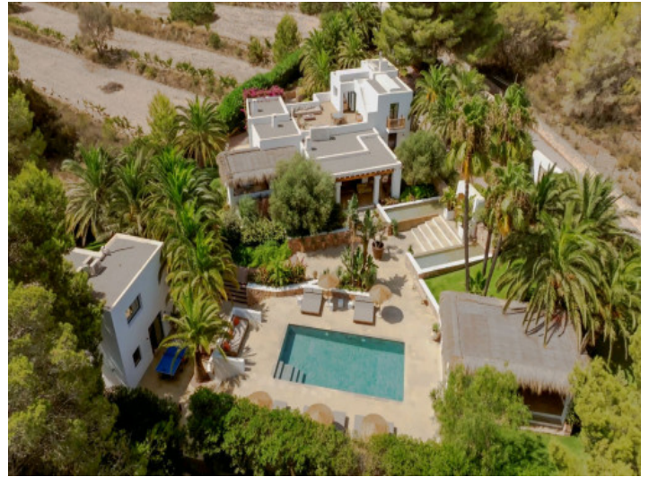
Ansicht auf die Villa