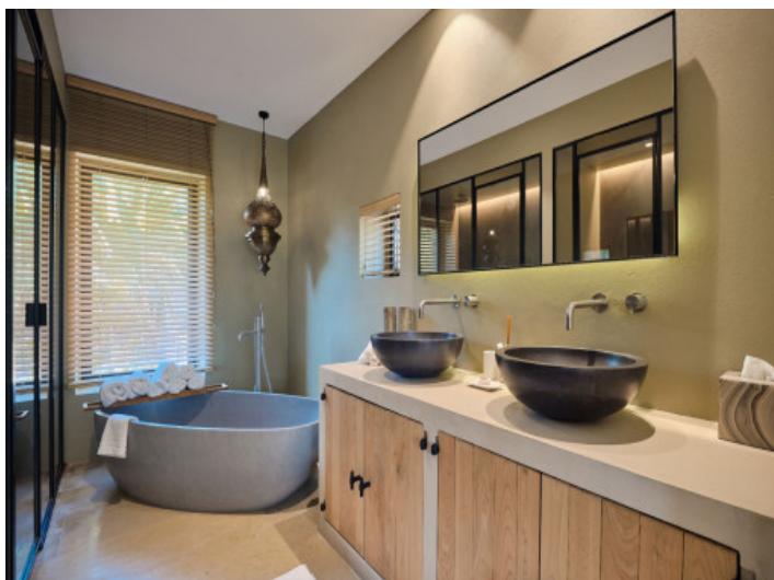
Villa mit 6 Badezimmern