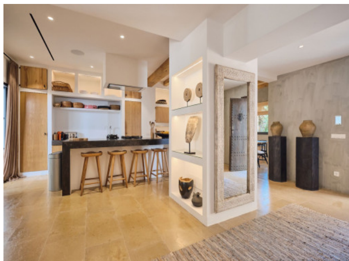
Küche im Landhausstil

Alle Angaben nach bestem Wissen. Irrtum und Zwischenverkauf vorbehalten. Dieses Exposé ist eine Vorinformation, als Rechtsgrundlage gilt allein der notariell abgeschlossene Kaufvertrag.