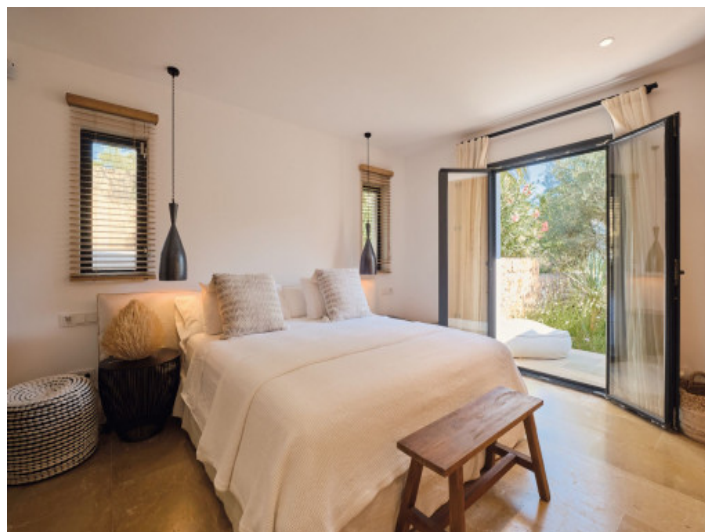
Eines von 6 Schlafzimmern