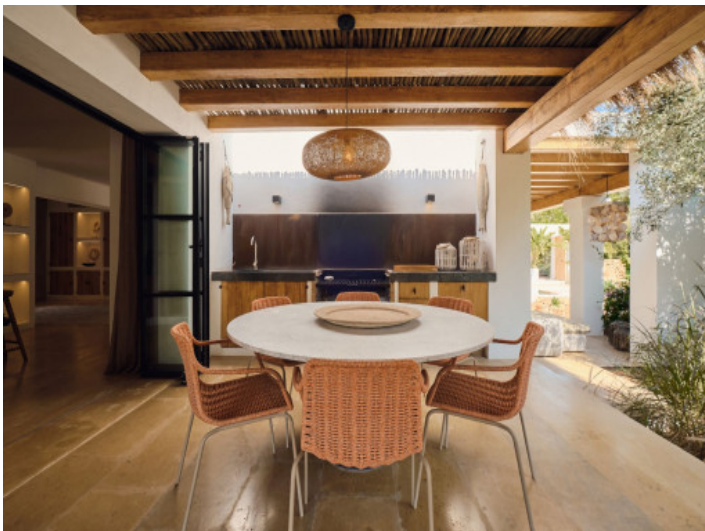
Essbereich auf der Terrasse