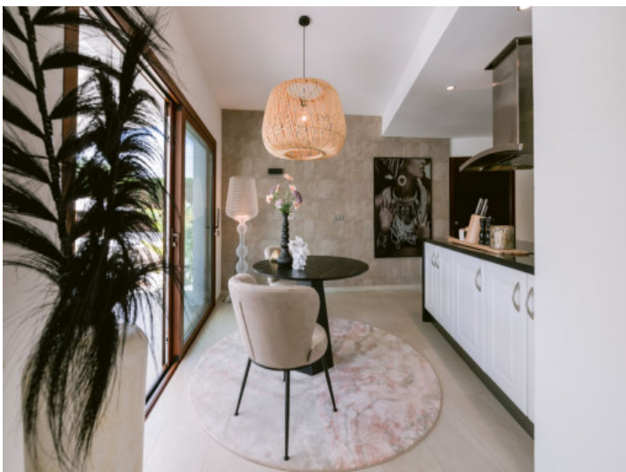
Essbereich bei der Küche