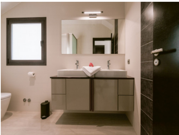
Badezimmer en suite