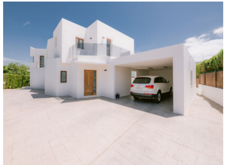
Frontansicht auf die Villa