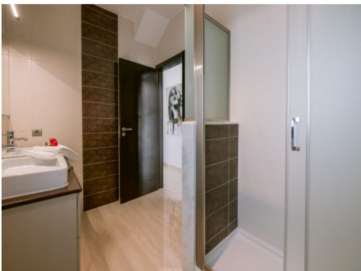
Eines von 5 Badezimmern