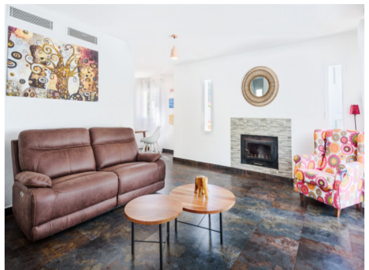
Wohnbereich mit kamin

Alle Angaben nach bestem Wissen. Irrtum und Zwischenverkauf vorbehalten. Dieses Exposé ist eine Vorinformation, als Rechtsgrundlage gilt allein der notariell abgeschlossene Kaufvertrag.