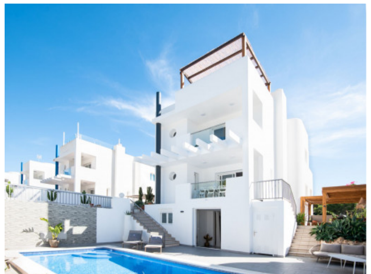
Ansicht auf die Villa