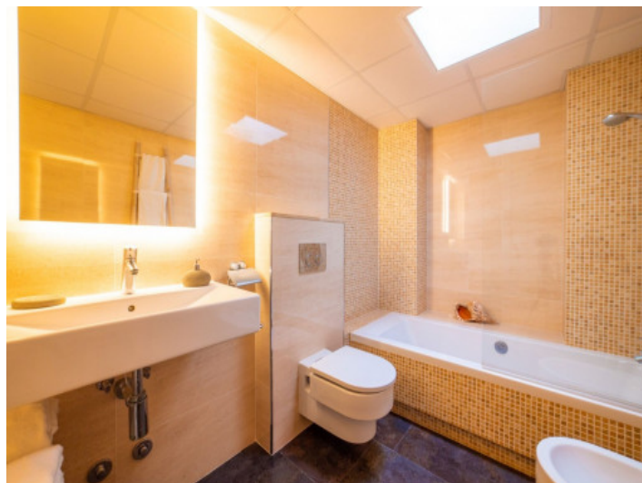
Eines von 4 Badezimmer