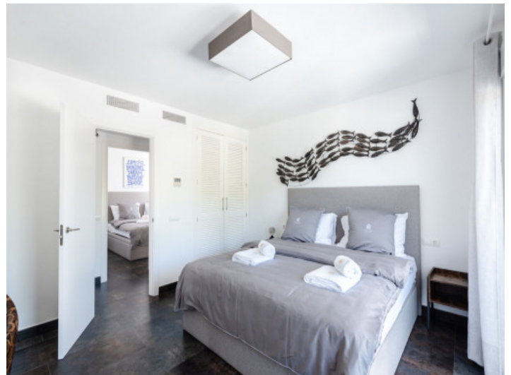
Eines von 5 Schlafzimmern