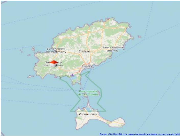
Sant Josep de sa Talaia